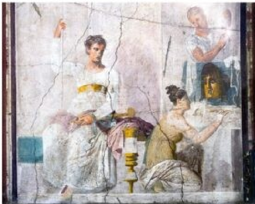
Aktor przebrany za króla i dwie muzy. Fresk z Herkulanum, 30-40 n.e. Plik ten jest licencjonowany na warunkach licencji Creative Commons Uznanie autorstwa-Na tych samych warunkach 4.0 Międzynarodowe .

Podczas gdy w teatrze greckim dominował chiton, w Rzymie podstawowym strojem scenicznym stała się toga. Rzymianie wprowadzili ideę fabula togata , w której sztuki komiczne były osadzone w kontekście rzymskim, a nie greckim. W tych przedstawieniach kostiumy odeszły od greckich płaszczy na rzecz ikonicznej rzymskiej togi – szerokiego, półokrągłego stroju. Był to strój charakterystyczny dla obywateli rzymskich, co już samo w sobie wskazuje na przesunięcie akcentu – z uniwersalnego, mitologicznego świata Greków ku bardziej społecznemu i obywatelskiemu charakterowi teatru rzymskiego. Rzymskie kostiumy nigdy nie były statyczne, ale płynnie dostosowywały się do zmieniających się gustów i wrażliwości widzów teatru w cesarstwie.