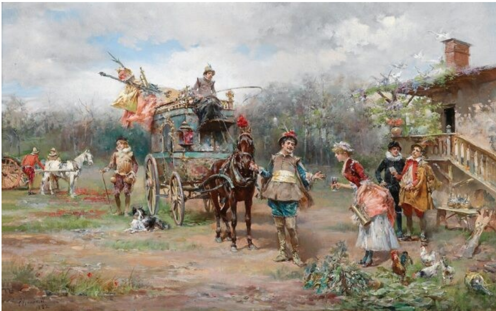
Popas francuskiej wędrowniej trupy teatralnej. Domena publiczna.

XVIII wiek był dla teatru europejskiego okresem intensywnych przemian artystycznych i społecznych. Zmieniały się formy dramatu, sposób gry aktorskiej, organizacja sceny oraz relacje między teatrem a publicznością. Przemianom tym towarzyszyła ewolucja kostiumu teatralnego, który stopniowo przestawał być jedynie dekoracyjnym symbolem bogactwa i pozycji społecznej, a zaczynał pełnić funkcję środka interpretacji postaci oraz budowania wiarygodności scenicznej. Był to czas przejściowy między barokową umownością a narodzinami realizmu i historyzmu w kostiumografii.