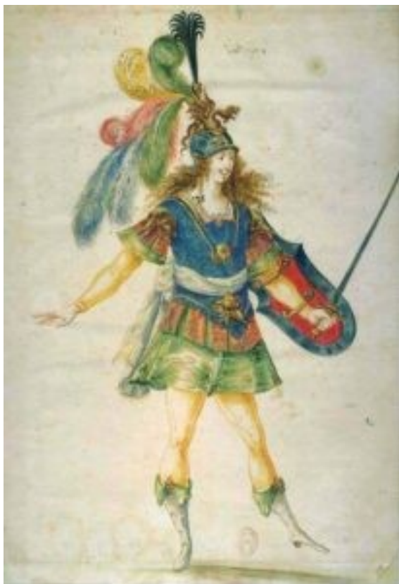
Strój żołnierza.