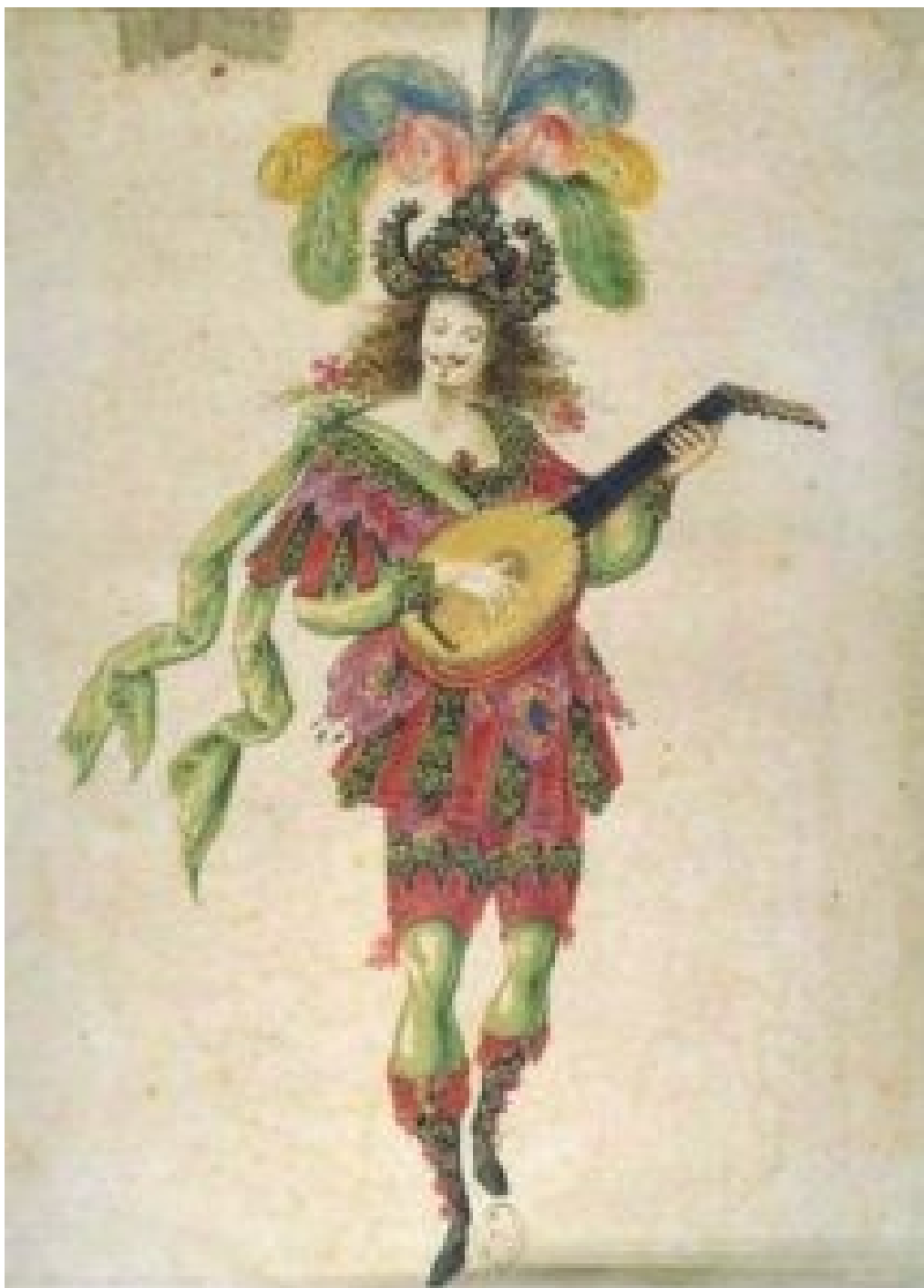
Strój lutnika.

Ważnym wydarzeniem były także uroczystości Plaisirs de l'Île enchantée organizowane w Wersalu. Wystawiono tam między innymi Księżniczkę d'Elide Moliera, w której sam Ludwik XIV pojawił się w kostiumie rycerza Rogera. Dworzanie występowali jako postacie pastoralne, satyrowie i bohaterowie mitologiczni. Scenografia, kostiumy i układ ogrodów wersalskich tworzyły wspólną teatralną przestrzeń, w której granica między spektaklem a rzeczywistością dworu praktycznie zanikała.