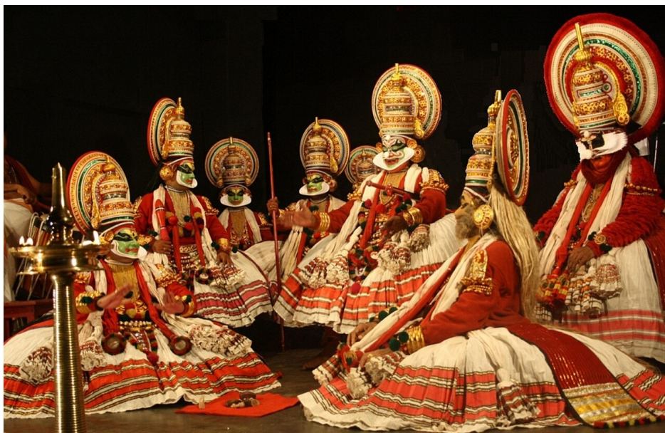
Kathakali, klasyczna forma teatru z Kerali w Indiach. CC BY-SA 3.0

Najbardziej widowiskową formą indyjskiego teatru jest bez wątpienia Kathakali, rozwijający się od XVI–XVII wieku w Kerali. Kathakali stanowi syntezę wcześniejszych tradycji, takich jak Kutijattam i Krishnanattam.