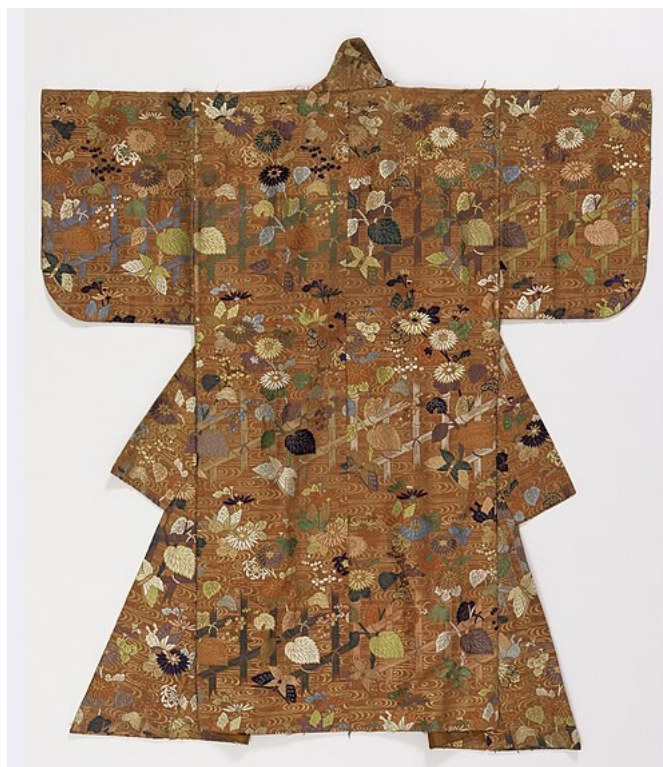
Kostium nō , ok. 1800 r. Domena publiczna.

Najważniejsze elementy kostiumów: bogato tkane jedwabie, wielowarstwowość stroju, szerokie rękawy i długie szaty, hafty wykonywane złotą i srebrną nicią, symboliczne wzory roślinne i geometryczne.