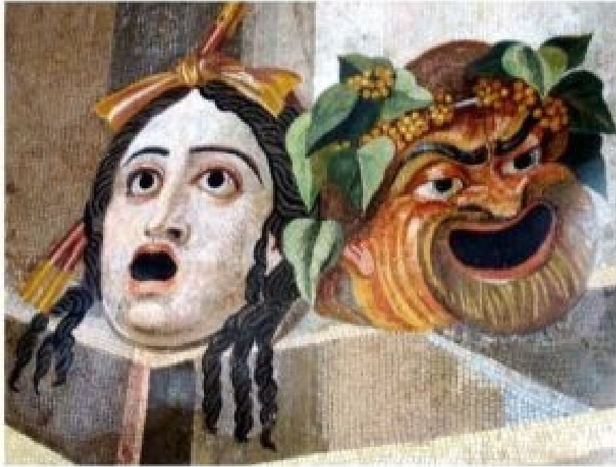
Tragiczne i komiczne maski, mozaika willi Hadriana. Domena publiczna.