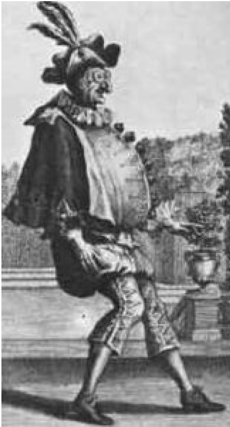
Projekt kostiumów dla Pulcinelli (1703). Domena publiczna.

Jean Berain projektował dla kobiet stroje wzorowane na modzie dworskiej Ludwika XIV. Charakteryzowały się one obcisłymi gorsetami, rozkloszowanymi baskinami i bogato dekorowanymi spódnicami z trenami. Ważną rolę odgrywały nakrycia głowy — kompozycje z piór, koronek i ozdobnych aplikacji. Kostium tworzył niemal jednolitą, monumentalną sylwetkę.