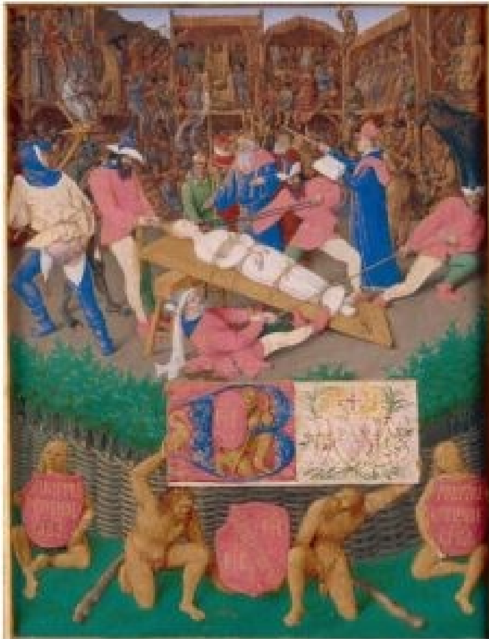
Jean Fouquet, Męczeństwo świętej Apollonii. Domena publiczna.

Najdroższym barwnikiem był kermes — uzyskiwany z rozgniecionych owadów żyjących na dębach. Dawał on niezwykle głęboki karmazynowy kolor i był symbolem luksusu.