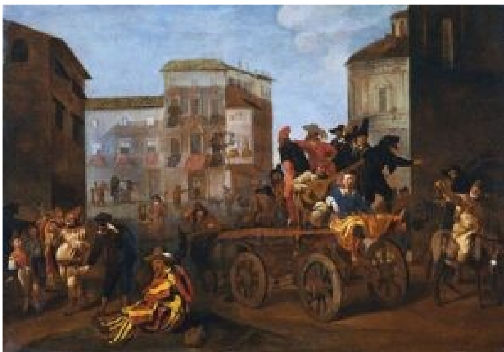
Commedia dell'Arte Trupa na wozie na rynku miejskim Jana Miela (1640). Domena publiczna.

W XVIII wieku Carlo Goldoni próbował zreformować włoską komedię, ograniczając improwizację i wprowadzając bardziej realistyczne dialogi. Stopniowo klasyczna forma commedii dell'arte zaczęła zanikać, jednak jej wpływ na teatr europejski pozostał ogromny.