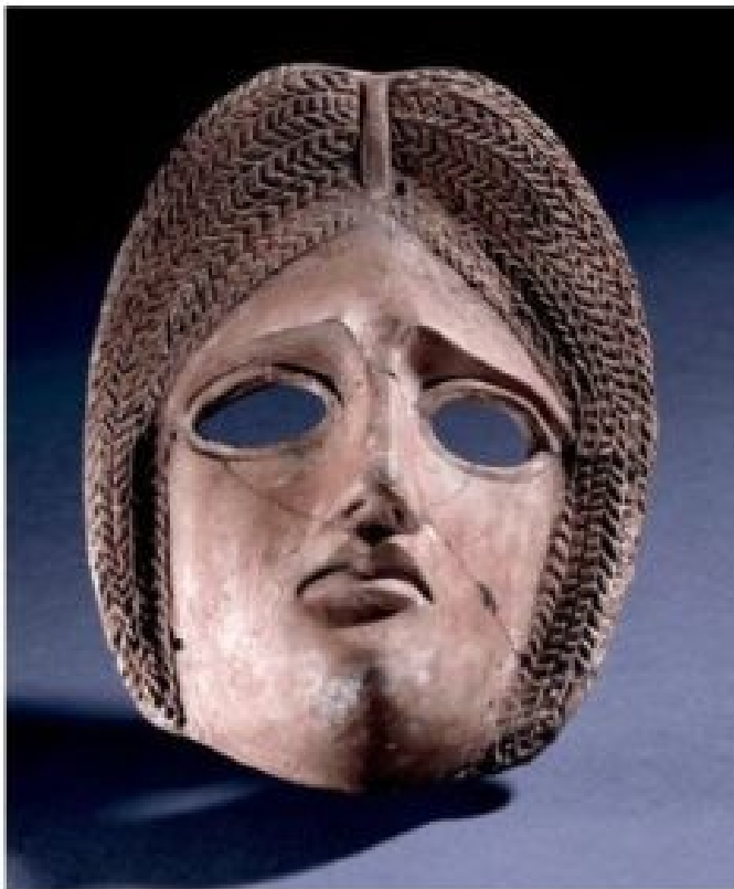
Starożytna rzymska maska teatralna. Około I-II wieku. Muzeum Brytyjskie.