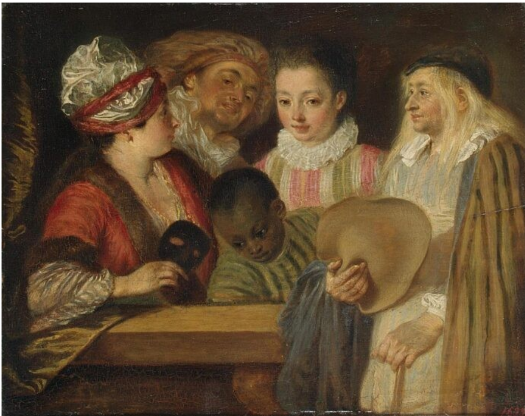
Jean-Antoine Watteau, Aktorzy Comédie-Française, między 1711 a 1718 rokiem, Ermitaż, Sankt Petersburg. Domena publiczna.

Epoka baroku przyniosła zupełnie nowe rozumienie sztuki. Renesansowa harmonia, spokój i matematyczny porządek ustąpiły miejsca dynamice, emocjom, iluzji i efektowi zaskoczenia. Sztuka przestała jedynie odzwierciedlać rzeczywistość — zaczęła przede wszystkim oddziaływać na odbiorcę, poruszać jego wyobraźnię i emocje. Dlatego barok często określa się mianem „sztuki ruchu” i „sztuki perswazji”.