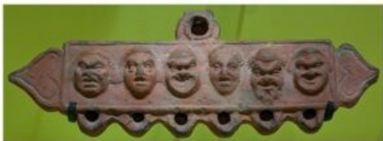
Lampa naftowa ozdobiona maskami komedii. Domena publiczna.

W czasach cesarstwa (od I w. p.n.e./n.e.) teatr stał się bardziej spektakularny i nastawiony na efekt: Kostiumy stały się bogatsze, bardziej dekoracyjne i realistyczne. Pojawiły się bardziej zróżnicowane materiały (jedwab, barwione tkaniny) oraz ozdoby. Maski zaczęły być mniej używane w niektórych formach (np. w pantomimie), gdzie większą rolę odgrywała mimika i gest. W widowiskach takich jak pantomima czy mim pojawiały się kostiumy bardziej dopasowane do ciała, podkreślające ruch. Częściej stosowano kostiumy historyczne lub egzotyczne, odpowiadające fabule.