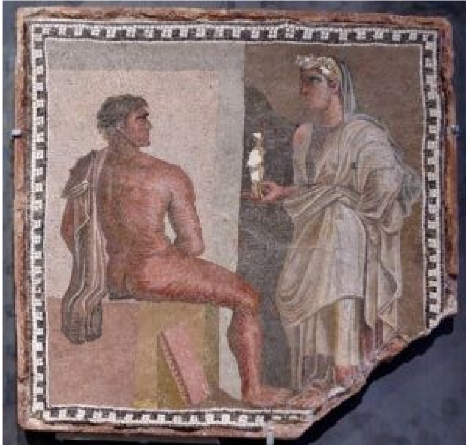
Mozaika Orestesa, głównego bohatera trylogii Ajschylosa, Oresteja . Domena publiczna .

Ajschylos wzmacniał teatralną „większość niż życie” swoich bohaterów korzystając z takich elementów kostiumu jak: długie, ciężkie szaty nadawały postaciom powagę i hieratyczność, koturny (wysokie obuwie) powiększały sylwetkę aktora oraz maski i stroje sprawiały, że postacie wyglądały niemal jak figury rytualne lub boskie, a nie ludzie codzienni. W efekcie bohater tragedii stawał się figurą o wymiarze niemal nadludzkim.