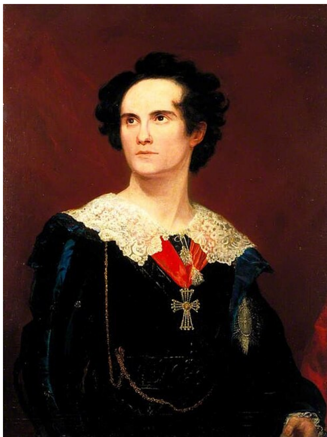
Charles Kean (1811–1868), jako Hamlet w „Hamlecie” Williama Szekspira, Samuel John Stump (1838). Domena publiczna.

Kean prowadził szczegółowe badania dotyczące epoki, architektury i dawnego ubioru. Jego przedstawienia wyróżniały się niezwykłą precyzją w odtwarzaniu historycznych detali. Szczególne znaczenie miała inscenizacja Makbeta z 1858 roku, przygotowana wspólnie z żoną, Ellen Kean. Aktorzy wystąpili w kostiumach inspirowanych XI-wieczną Szkocją, co było całkowitym odejściem od wcześniejszej praktyki ubierania bohaterów Shakespeare'a w stroje współczesne epoce wykonawców.