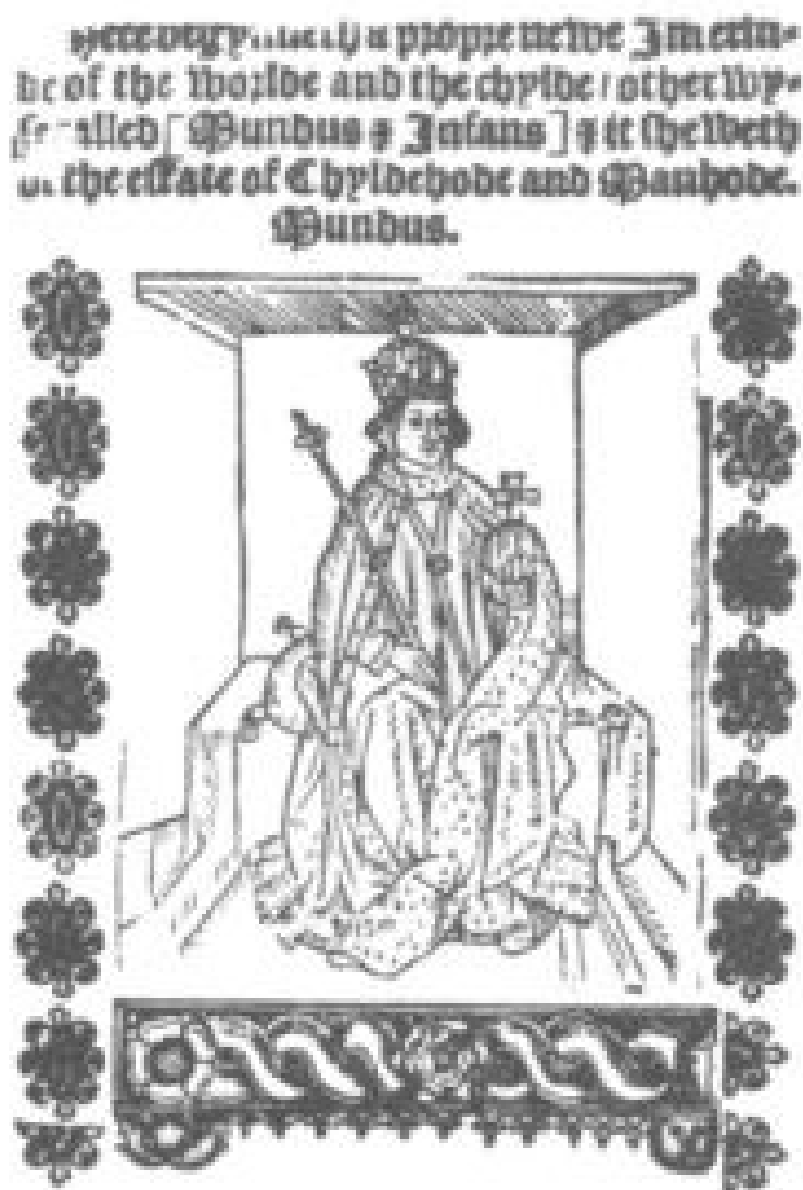
Okładka moralitetu Mundus et Infans z 1522 r. Domena publiczna.

W teatrze religijnym kostium pomagał odróżnić postacie świętych, aniołów czy diabłów. Anioły ubierano w jasne, bogato zdobione szaty, natomiast postacie demoniczne często otrzymywały kostiumy o ostrych liniach, ciemnych kolorach i groteskowych detalach. W widowiskach dworskich stroje podkreślały hierarchię społeczną oraz splendor dworu. Dzięki temu gotycki kostium teatralny stał się ważnym środkiem budowania nastroju i wyrazistości scenicznej, a jego wpływy można odnaleźć także w późniejszych epokach teatru historycznego i operowego.