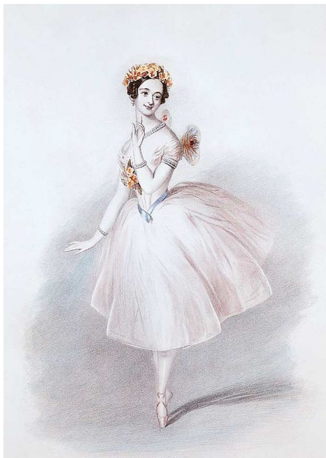
Maria Taglioni jako Sylfida w balecie „La Sylphide” Filippo Taglioniego, 1832.

Najbardziej charakterystycznym symbolem romantycznego baletu stał się jednak kostium z baletu Sylfida z 1832 roku. Projektant Eugène Lami stworzył dla Marie Taglioni lekką, zwiewną suknię z muślinu, która stała się wzorem klasycznego tutu romantycznego. Kostium ten podkreślał eteryczność postaci i iluzję unoszenia się nad ziemią, idealnie odpowiadając estetyce romantyzmu.