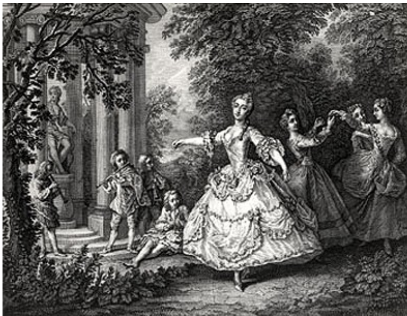
Sallé, ok. 1730, według Nicolasa Lancreta.

Reformy szczególnie widoczne były w teatrze operowym i balecie. Francuska tancerka Marie Sallé wystąpiła w balecie Pigmalion (1734) w lekkiej muślinowej sukni inspirowanej sztuką antyczną, rezygnując z gorsetów, panierów i ciężkich ozdób. Jej występ był przełomowy, ponieważ po raz pierwszy kostium podporządkowano ruchowi i ekspresji ciała.