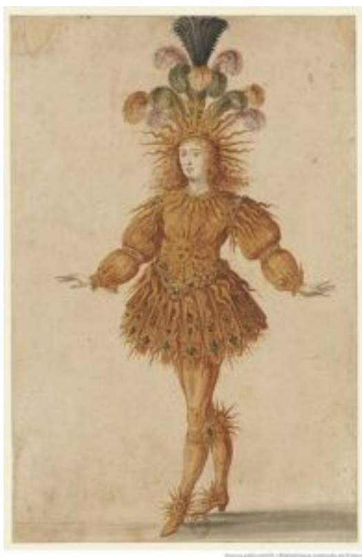
Strój Apollona, wykonany przez Ludwika XIV. Domena publiczna.