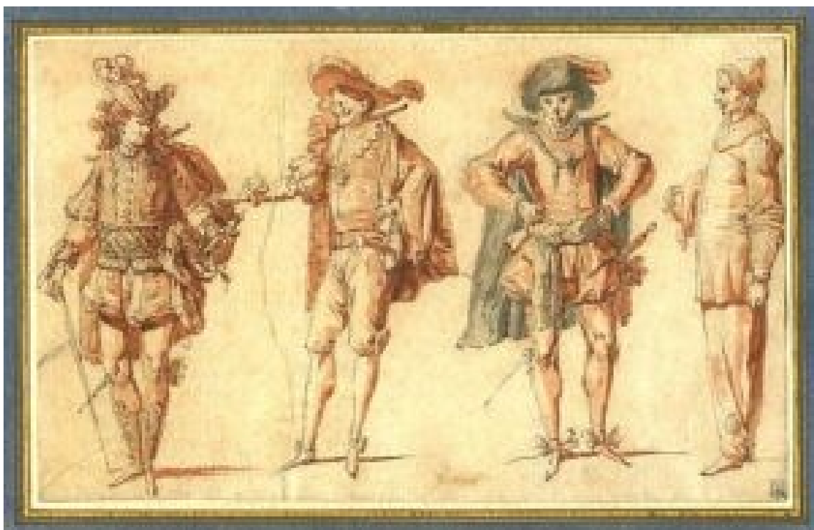
Claude Gillot (1673–1722), Cztery postacie z Commedia dell'Arte: Trzej panowie i Pierrot , ok. 1930-1999. 1715

Spektakle wystawiano na ulicach, placach miejskich oraz dworach. Wędrowne trupy aktorskie podróżowały od miasta do miasta, prezentując widowiska oparte na prostych scenariuszach zwanych canovacci. Zawierały one jedynie zarys fabuły, natomiast dialogi i większość komicznych sytuacji powstawały spontanicznie podczas przedstawienia.