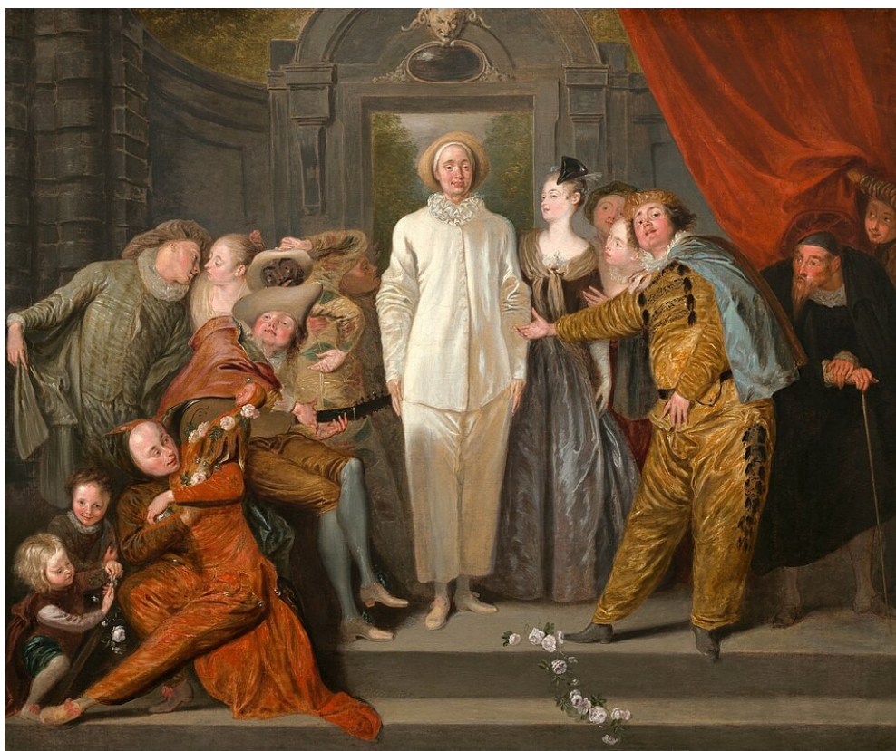
Jean-Antoine Watteau, Włoscy komicy , ok. 1719–1721, National Gallery of Art, Waszyngton, DC. Domena publiczna

Przejście od późnego baroku do rokoka doskonale ukazuje twórczość Jean-Antoine'a Watteau. Artysta fascynował się światem teatru, szczególnie commedia dell'arte i baletem. W jego obrazach pojawiają się postacie teatralne w fantastycznych kostiumach: Pierrot, Harlekin, Columbina czy Mezzetin.